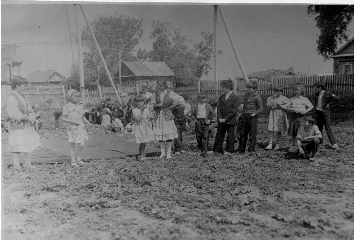
1989 ел. Пионер сабан туеннан күренешләр. Ягез, кем өлгер, кем житез?