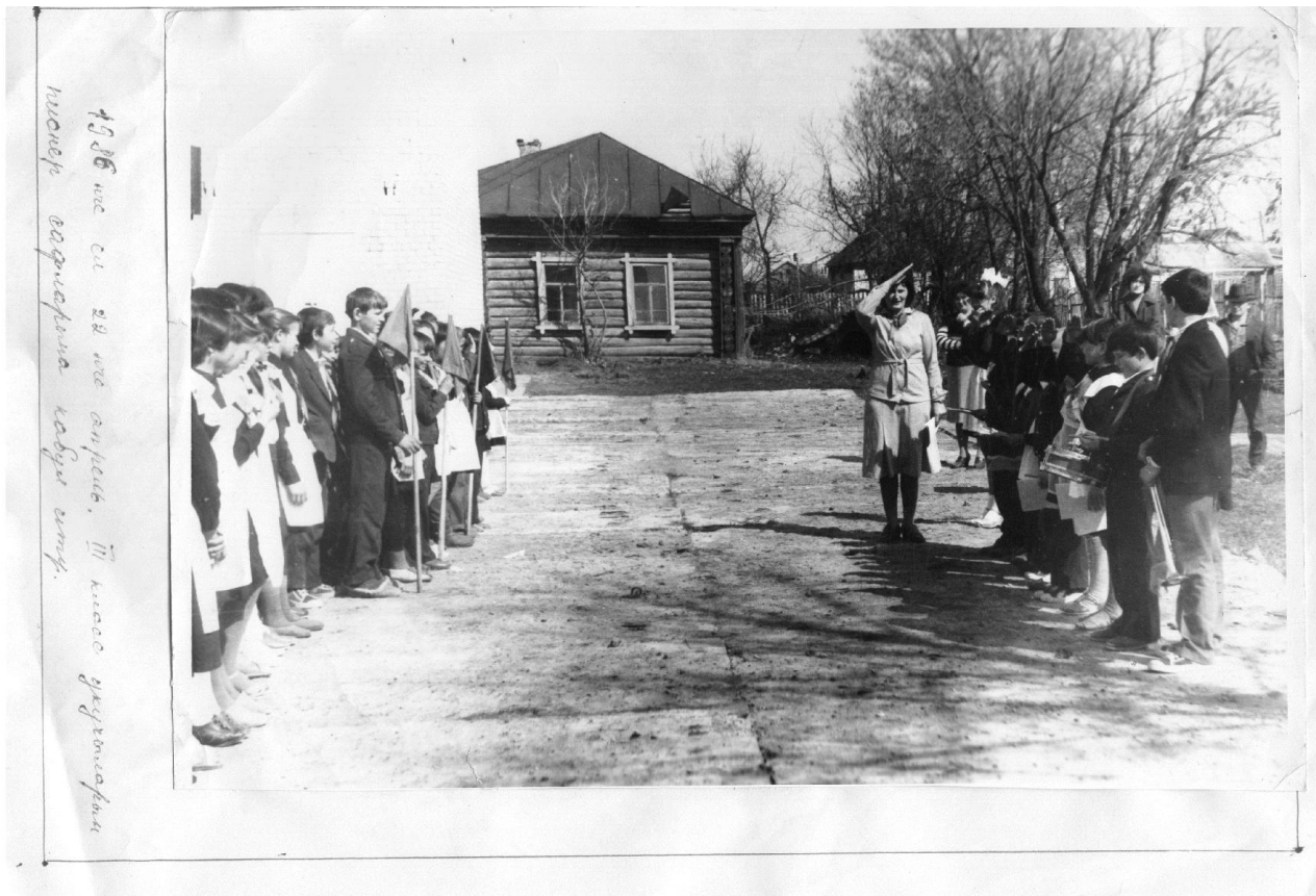
Айга бер тапкыр актив укуы алып барыла иде. Аны дружина советы председателе житэкли иде.