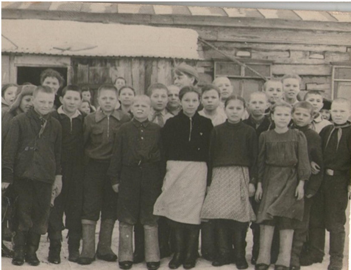
1962 нче еллар. Пионерлар һәм комсомоллар

(әби-бабайларның, эти-эниләрнең, укытучыларның шәхси архивынан истәлекләр)