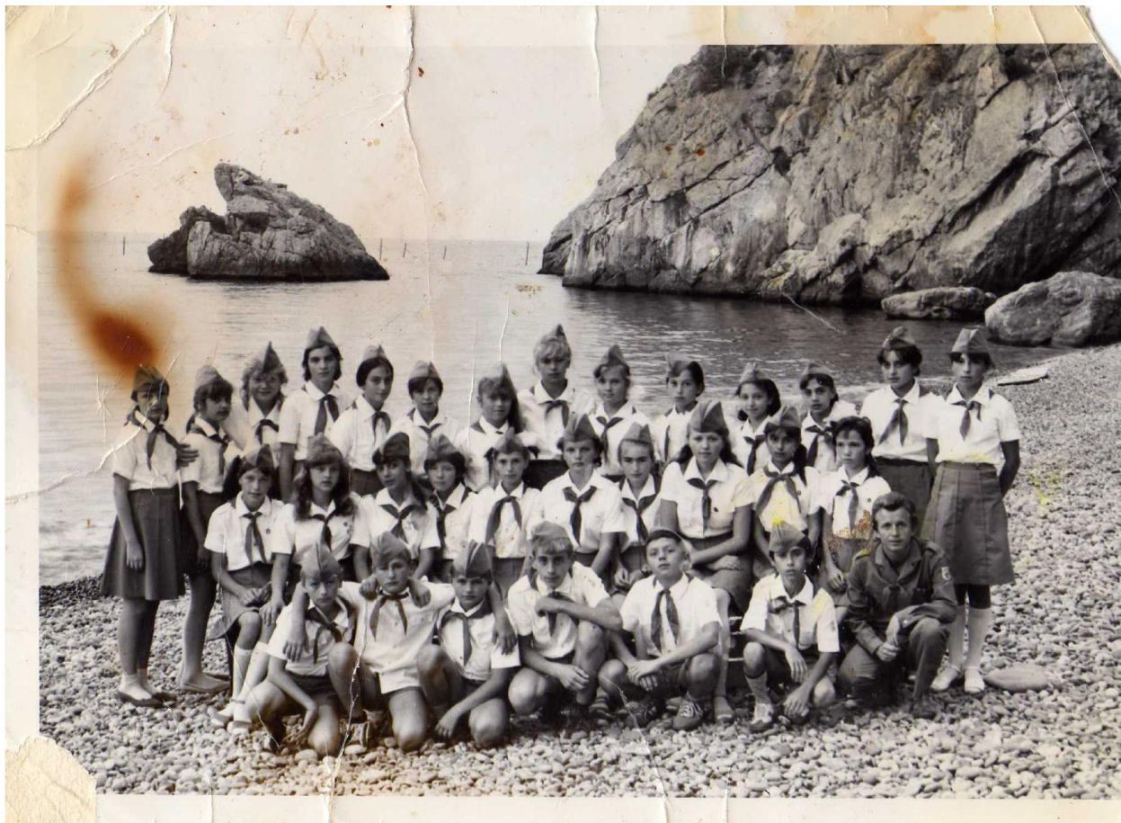
Лагерь дөнъяның жәннәткә тиң бер почмагына — Кара дингез буена, Аюдаг итәгенә урнашкан.