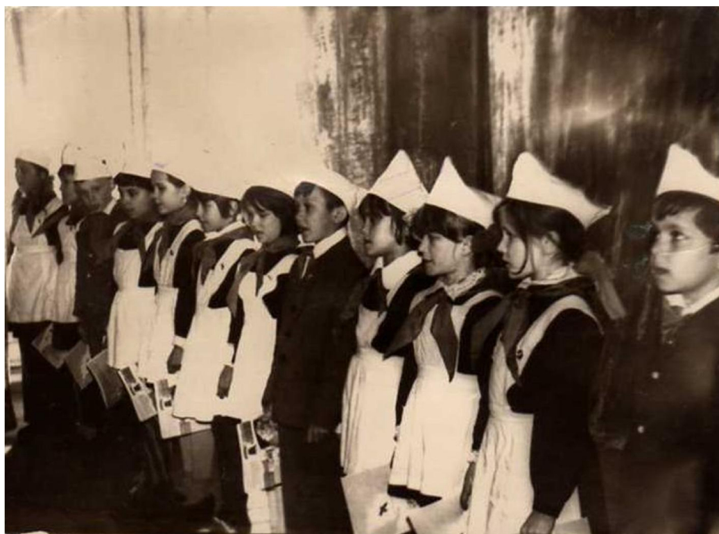
1977 ел. 22 апрель. 3 нче сыйныф укучылары пионер булдылар.

Шатлыгыбызны күрсеннәр диеп, Бөтен урамны шаулатып йөрдек. Иң истәлеке көнебез бүген- Без пионерга кабул ителдек. Инде без зурлар, без- пионерлар!